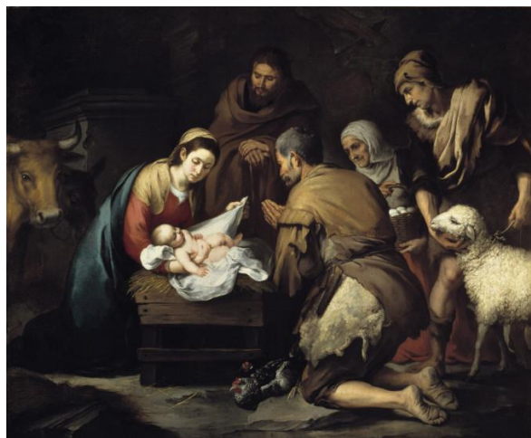
Bartolomé Esteban Pérez Murillo, (1650-1655), olio su tela, 187 x 228, Madrid, Museo del Prado.